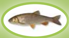
Kleń - 30 cm