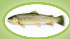
Pstrąg potokowy - 25 cm