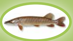
Szczupak - 45 cm