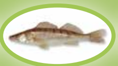
Sandacz - 42 cm