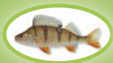
Okoń - 22 cm