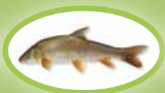
Śliz pospolity - 30 cm