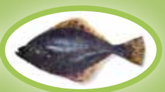
Flądra - 20 cm