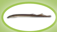
Minóg rzeczny - 20 cm