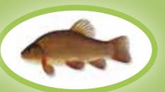
Lin - 25 cm

W przypadku złowienia ryby mniejszej niż obowiązujący dla niej wymiar ochronny, należy ją natychmiast wrzucić z powrotem do tego samego zbiornika wodnego!